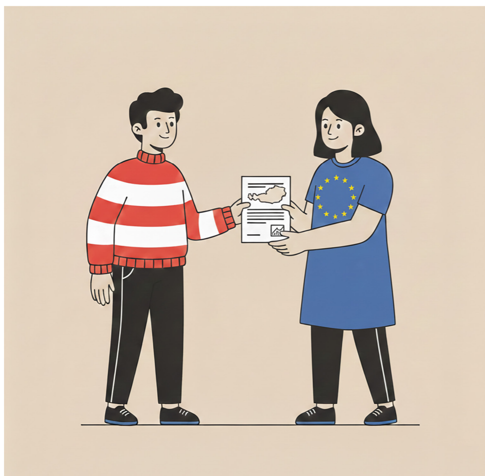
Bild 2: Übergabe des Leistungsberichts an die Europäische Kommission.

Mehr Infos zum Leistungsbericht für das Jahr 2025 gibt es unter Punkt 3.