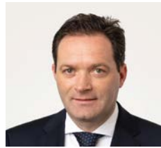
Norbert Totschnig Bundesminister für Land- und Forstwirtschaft, Klima- und Umweltschutz, Regionen und Wasserwirtschaft

In Österreich gibt es rund 8.000 bewirtschaftete Almen und Weiden. Sie sind Natur pur, geschätzte Urlaubsziele und wichtige Wirtschaftsräume. Dass das so ist, verdanken wir unseren Bäuerinnen und Bauern. Sie pflegen diese schönen Naturlandschaften und wahren mit dem Almauftrieb von Weidevieh eine jahrhundertealte Tradition. Österreichs Almen und Weiden prägen unsere Kulturlandschaft, stehen für regionale Lebensmittel und natürliche Vielfalt. Sie sind aber auch ein wichtiger Tourismusfaktor.